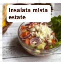
Insalata mista estate