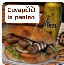
Cevapčići in panino