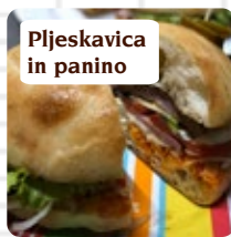
Pljeskavica in panino