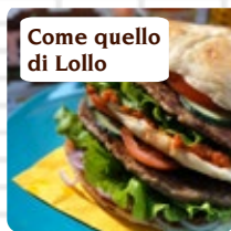
Come quello di Lollo