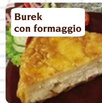
Burek con formaggio